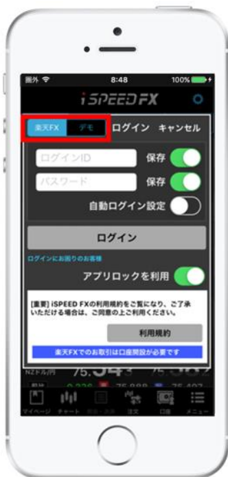
「楽天 FX ログイン画面」