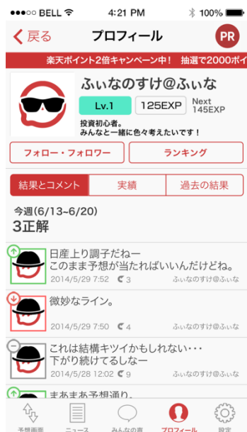
プロフィール画面

自分のプロフィールを確認し、フォローやフォロワー、ランキング、実績、過去の結果などを参照することができます。