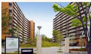
大阪府内のニュータウンの再生