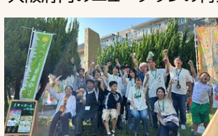
地域コミュニティの活性化