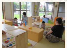
子育てしやすい住宅環境の整備