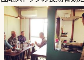
高齢者の孤食防止の推進