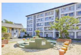
アフォーダブル住宅の安定供給