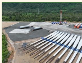
ラオス 建設が進む風力発電設備